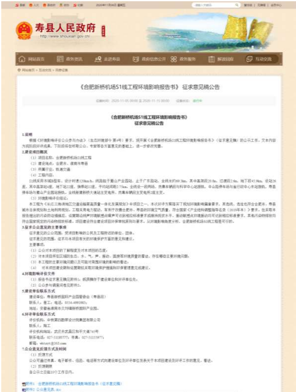
图 3 征求意见稿网络公示截图（寿县人民政府网站）