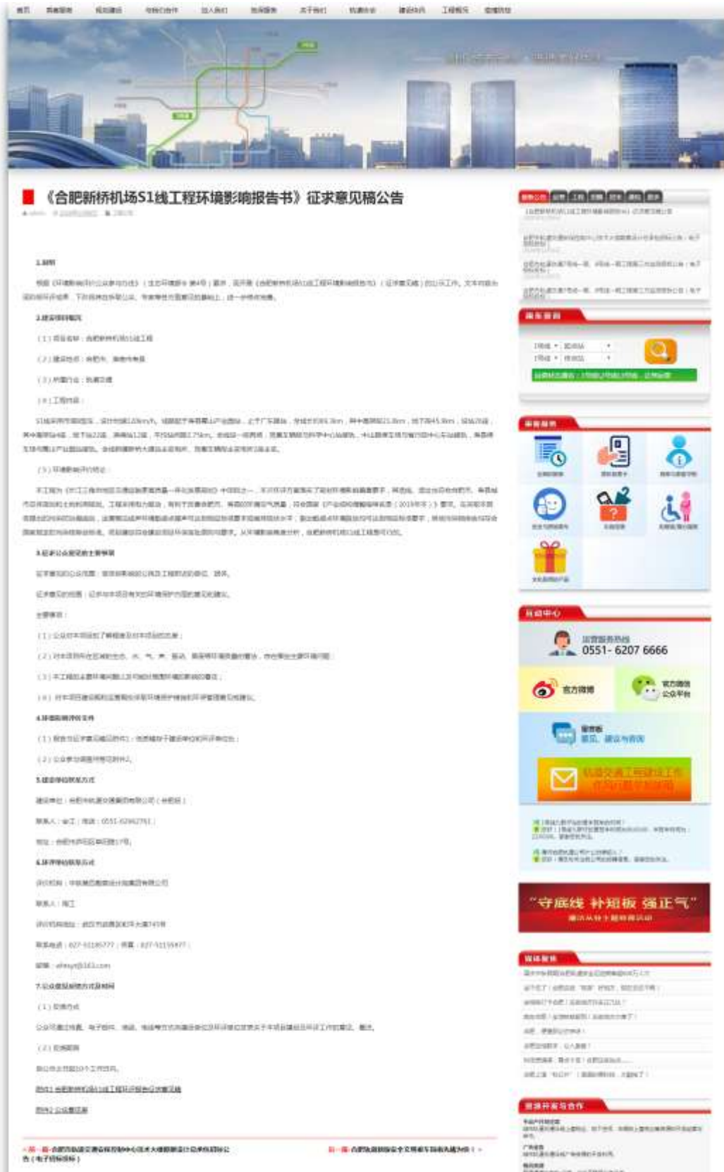
图 4 征求意见稿网络公示截图（合肥市轨道交通集团有限公司网站）