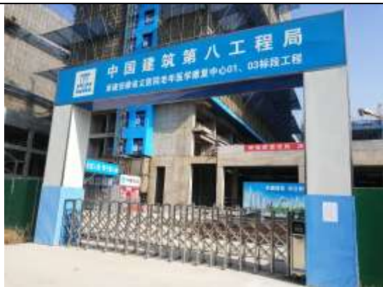
安徽省立医院老年医学康复中心