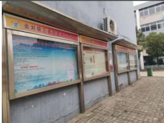
三关村村委会（井河、白水塘村）