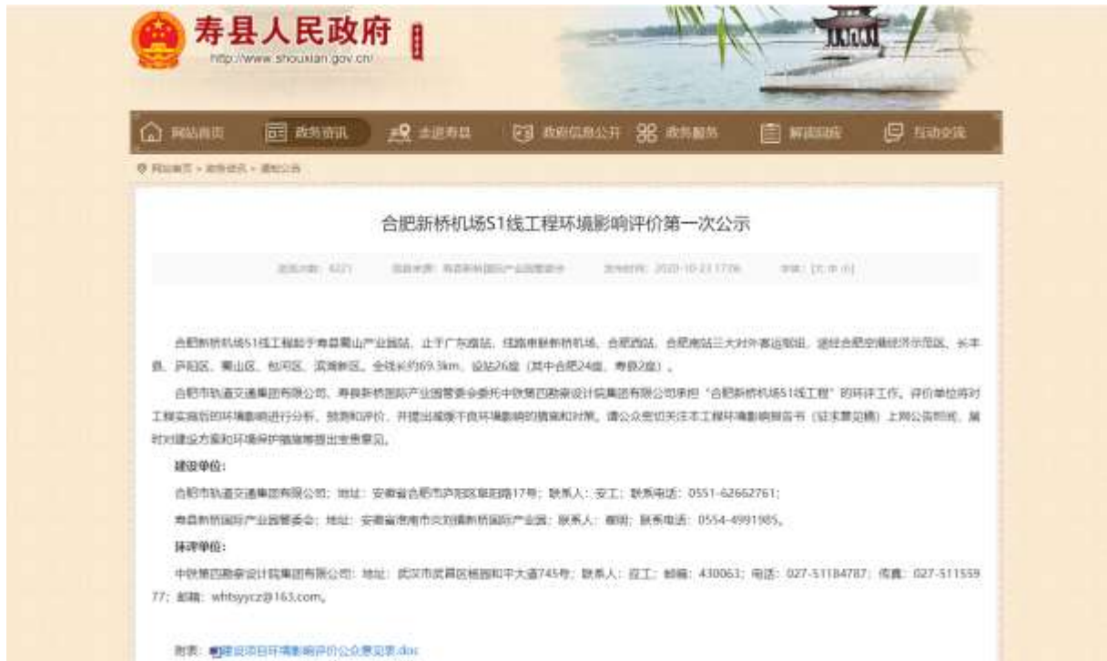
图 2 寿县人民政府网站网站第一次信息公示网站截图