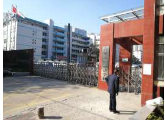
合肥体育运动学校