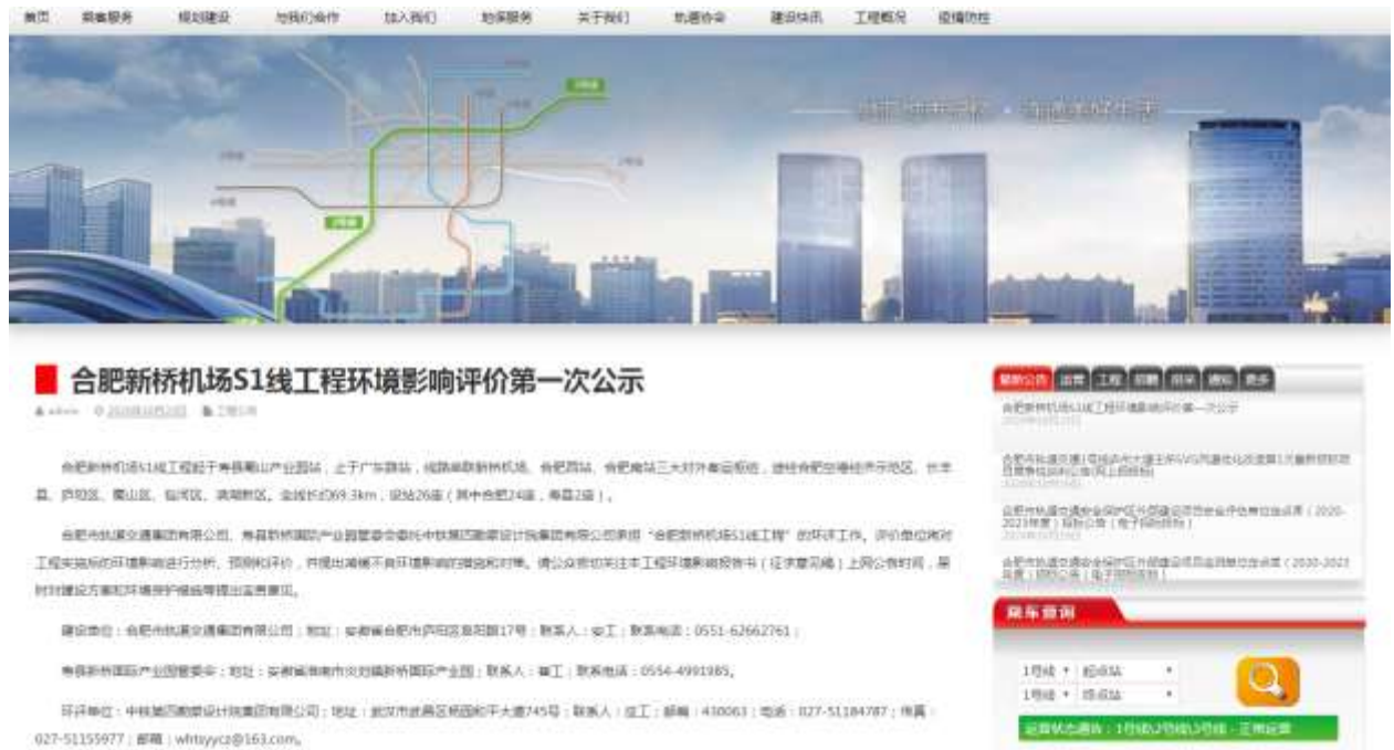
图 1 合肥市轨道交通集团有限公司网站第一次信息公开网站截图

第一次信息公开在合肥市轨道交通集团有限公司网站（ http://www.hfgdjt.com/ ）、寿县人民政府网站（ http://www.shouxian.gov.cn ），公示截图见图 1、图 2。