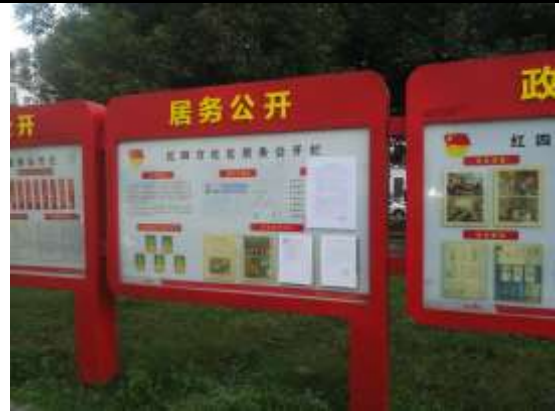
红四方社区居委会（四方新村、四方北区）