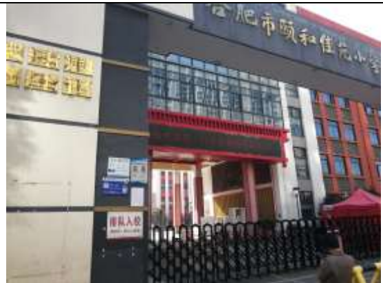
合肥市颐和华苑小学