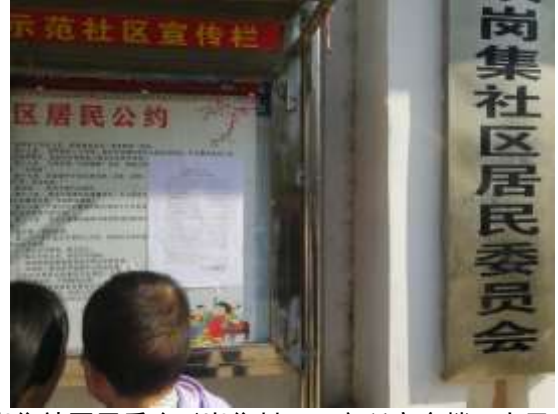
岗集社区居委会（岗集村、工商所宿舍楼、人民政府家属楼、金明花园）