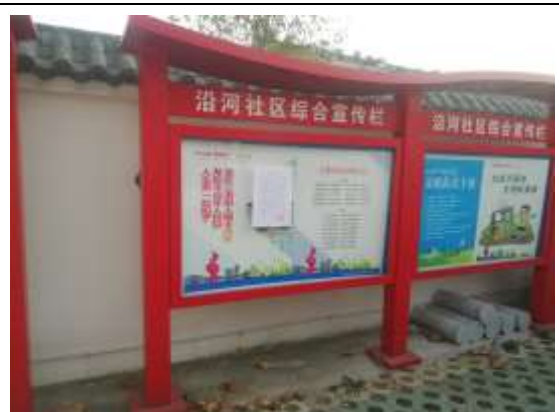
沿河社区居委会（广福花园）