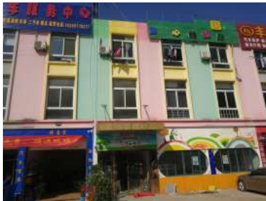
岗集智慧树幼儿园