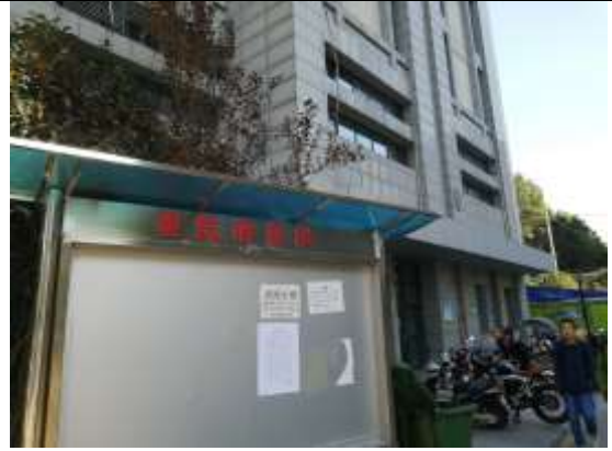
通合易居同辉南苑