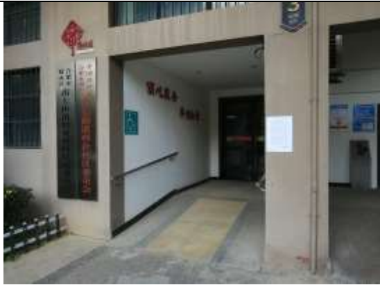
科企社区居委会（建业领翔）