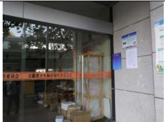
省卫健委中心、卫健委中心家属楼