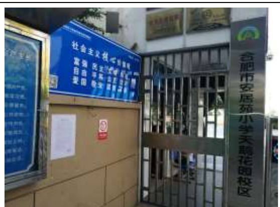
安居苑小学教育集团天鹅花园校区