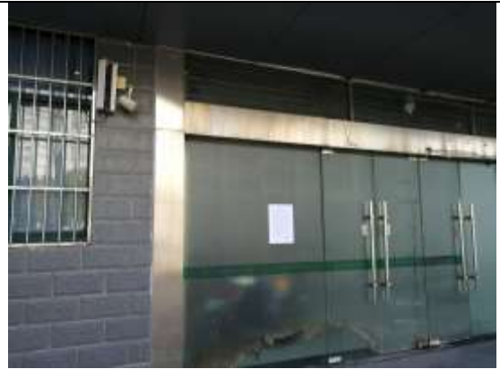
陆军军官学院医院