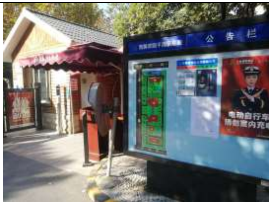
东汽小区、南屏家园