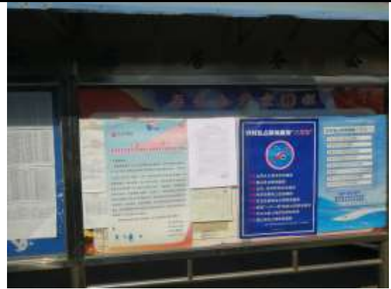
南洪社区居委会（南洪村、张小圩）