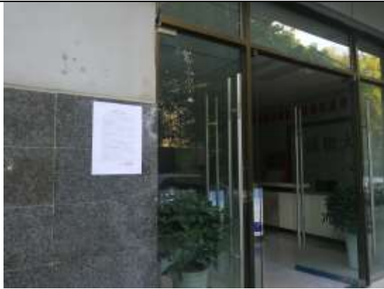
通合大厦 B 座