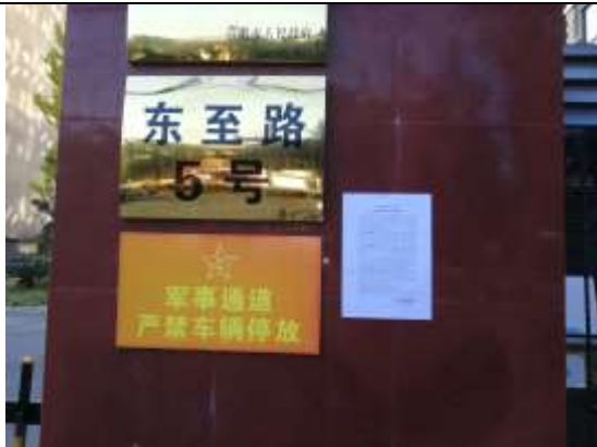
陆军军官学院宿舍