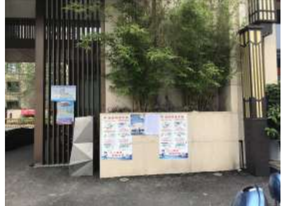
合肥医健新安护理院