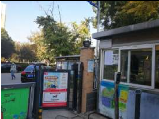
颐和花园澜苑、昆苑