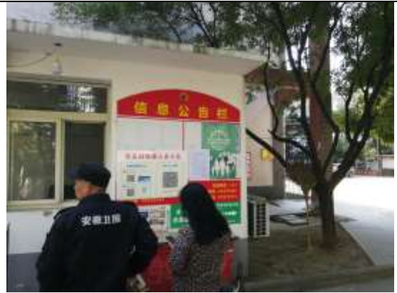
解放军电子工程学院家属楼、干休所