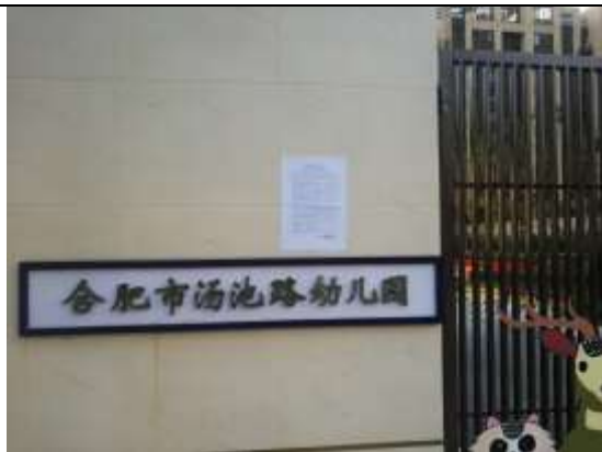
天鹅湖 MOMA 幼儿园