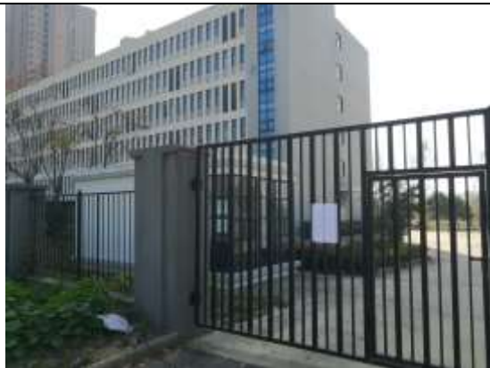
安徽农业大学教学科研示范基地