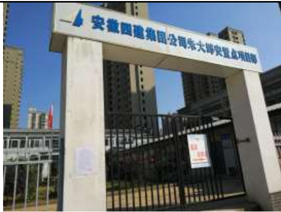
在建朱大郢城中村改在项目