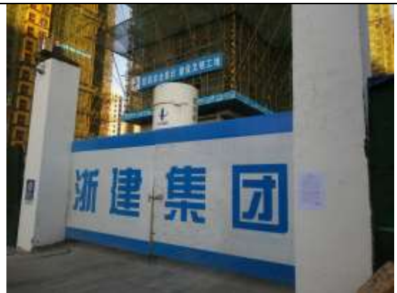
合肥国际人才公寓