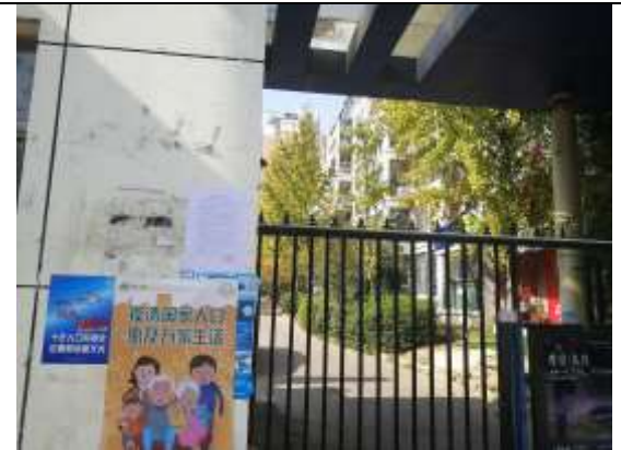
龙居山庄盘龙居、腾龙居