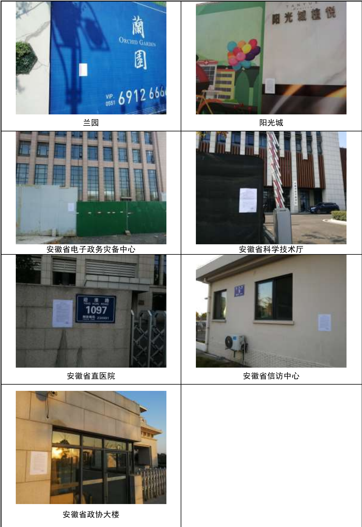
图 7 沿线张贴公告照片