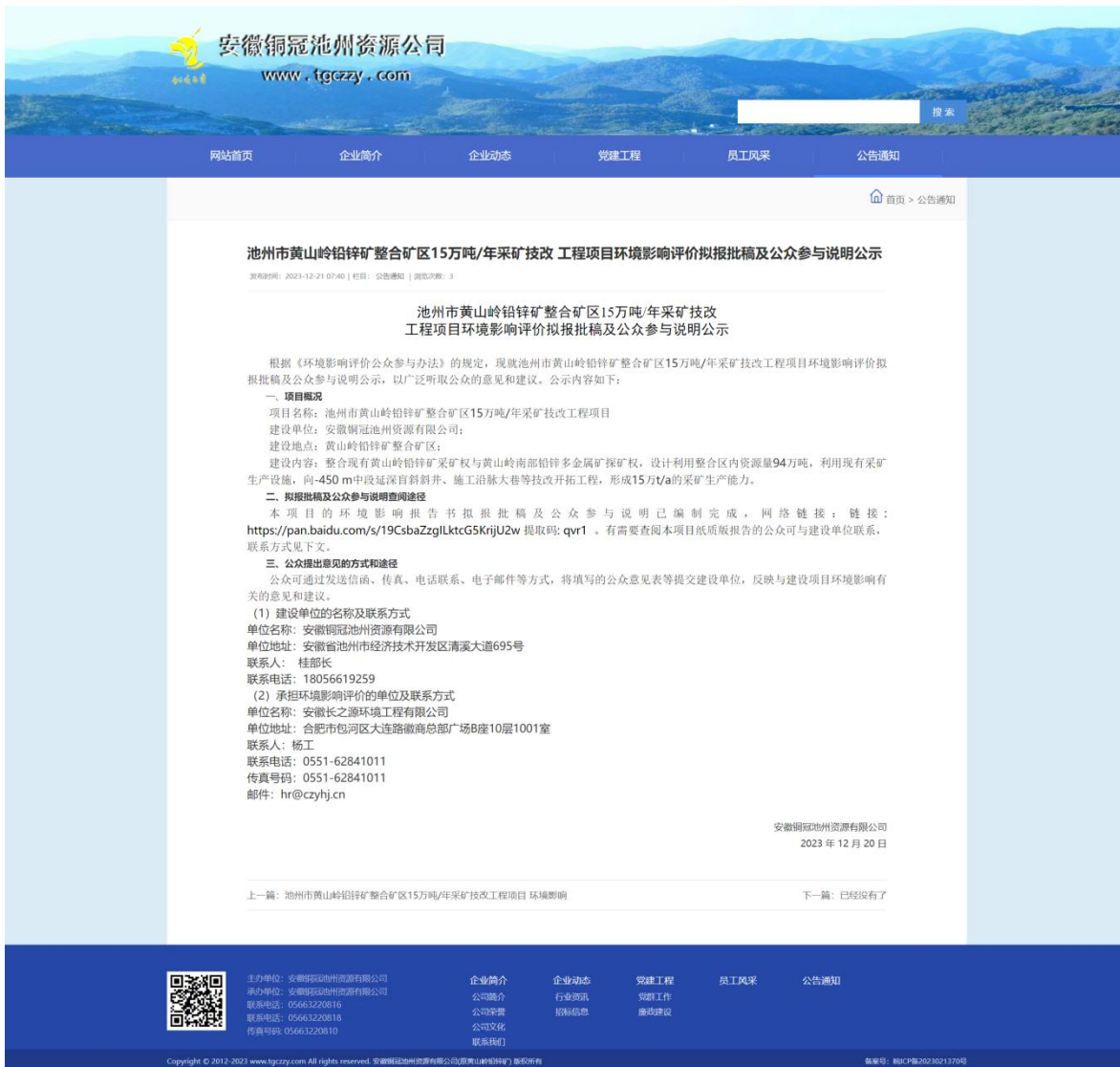
图6 项目环境影响报告书（拟报批）网络公示截图

http://www.tgczzy.com/shows/51/736.html 。本次网络公示的截图见下图6所示。