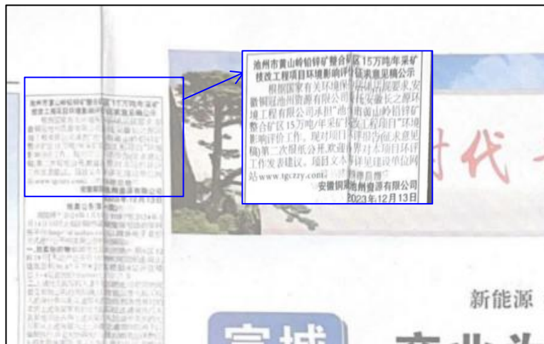
图4b 环境影响报告书征求意见稿第二次报纸公示截图