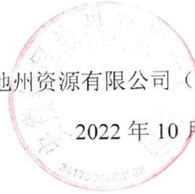
图1 项目环境影响评价工作委托书扫描件