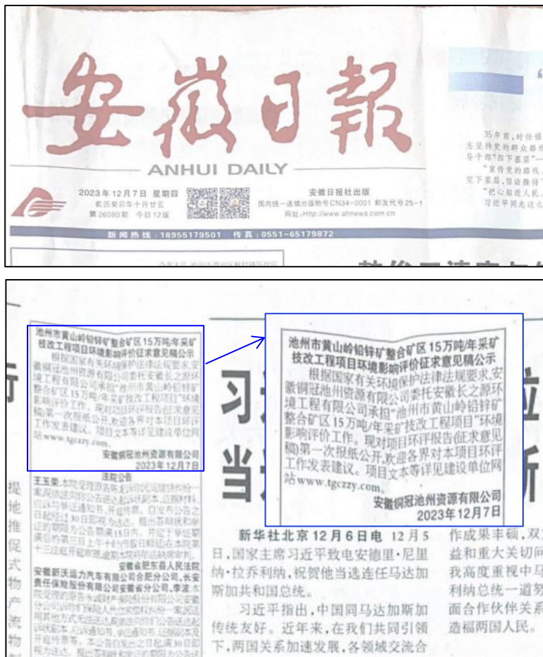
图4a 环境影响报告书征求意见稿第一次报纸公示截图

项目环境影响报告书征求意见稿报纸公示选择的载体为安徽日报。《安徽日报》是安徽省委机关报，创刊于1952年6月1日。是安徽省内发行数量最大的综合性对开日报，在省内各城市发行到机关、企业、事业单位的科室、车间、党支部，在省内农村发行到70几个县的每个乡镇的行政村及乡镇，拥有上千万读者，并在省外各大中城市发行万余份。安徽日报属于建设项目所在地公众易于接触的报纸载体类型，报纸公示的选取符合《环境影响评价公众参与办法》的相关要求。报纸公示的内容主要为报告书征求意见稿及公众意见表的网络链接、查阅方式、联系方式等基本信息。两次登报公示时间分别为2023年12月7日、2023年12月13日，满足《环境影响评价公众参与办法》中“建设项目所在地公众易于接触的报纸公开，且在征求意见的10个工作日内公开信息不得少于2次”的要求。两次报纸公示的截图信息见下图4所示。