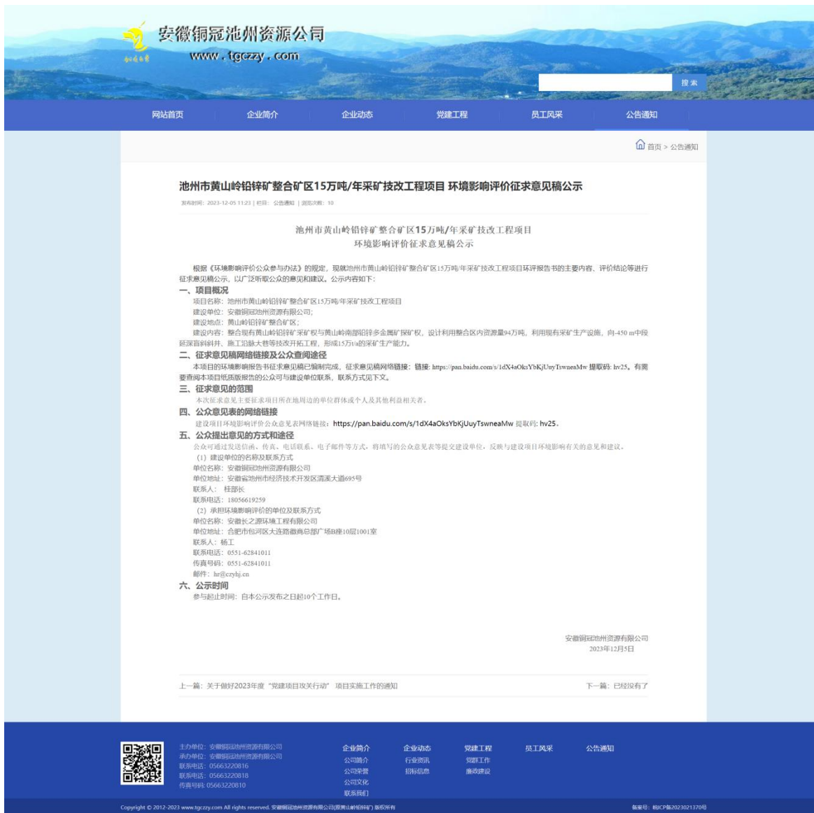
图3 项目环境影响报告书征求意见稿及公参调查表网络公示截图

《环境影响评价公众参与办法》的相关要求。征求意见稿及公参调查表下载链接为： http://www.tgczzy.com/shows/51/733.html 。公示时间满足《环境影响评价公众参与办法》中“持续公开期限不得少于10 个工作日”的要求。本次网络公示的截图见下图3 所示。