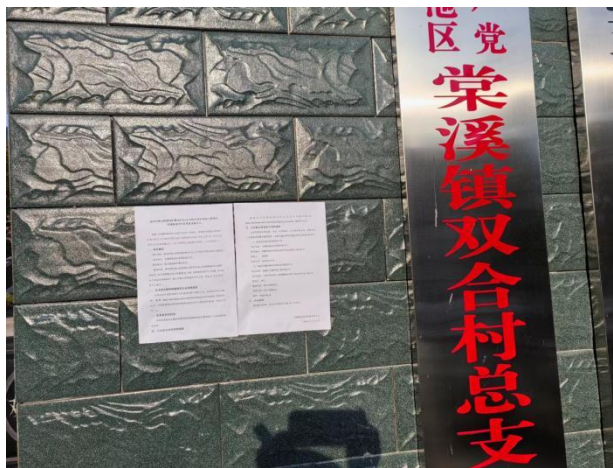
棠溪镇双河村村委会